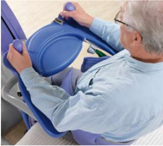
El Arc-Rest ofrece excelente soporte y promueve una sensación de seguridad.