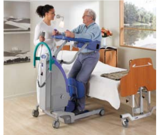
Un solo cuidador puede realizar transferencias, de manera segura y eficaz.

El sling forma parte integral del Círculo de Confort y se ofrece una amplia selección de ellos para satisfacer necesidades específicas. Además del sling bipedestador básico, hay un sling BOS/EPS especial que permite al residente mantenerse en una posición más erguida, más favorable para la rehabilitación. El sling para transferencias/caminar brinda apoyo a residentes que deben ser transferidos sentados, y también resulta ideal para ejercicios de caminar.