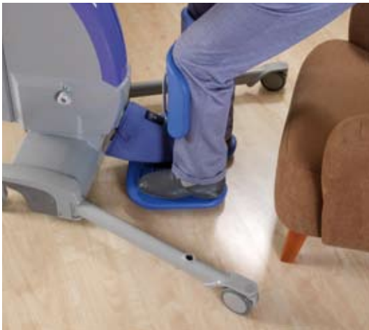
Para las transferencias, el chasis motorizado puede abrirse para acceso óptimo.