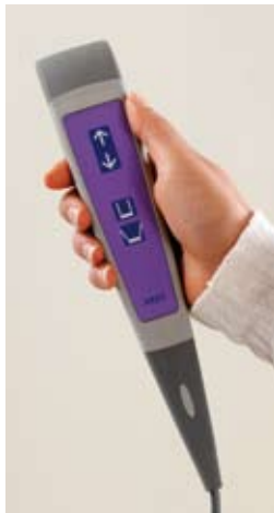
Controles dobles. ¿Mando de control o panel de control en másfil? El cuidador puede seleccionar el medio de control más conveniente de acuerdo con su situación determinada.