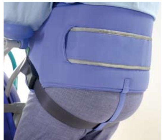
El soporte de una posición de pie más erguida hace que el sling BOS/EPS sea ideal para ejercicios de rehabilitación.