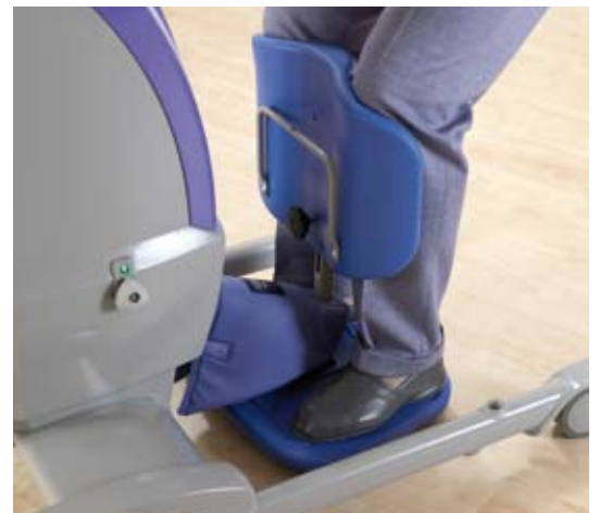
El apoyapiés brinda seguridad y estabilidad, mientras que el acolchado Pro-Active permite flexionar el tobillo de manera natural.